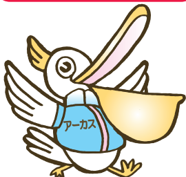
かいすけイメージキャラクター/だんどりくん